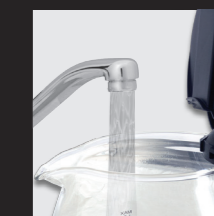
Ausschließlich mit kaltem Wasser füllen und den Deckel schließen