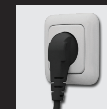
Vor Gebrauch Netzstecker einstecken

Den Wasserkocher bis zur MAX -Markierung mit kaltem Wasser ohne Zusätze füllen, einschalten und Wasser aufkochen. Diesen Vorgang 2-3 mal wiederholen. Dadurch werden eventuelle Rückstände vom Herstellungsprozess beseitigt.