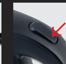
Der Wasserkocher schaltet sich automatisch aus