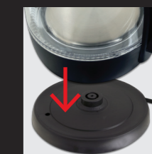
Wasserkocher auf den Heizsockel stellen