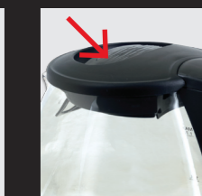
Deckelentriegelungstaste drücken und Deckel öffnen