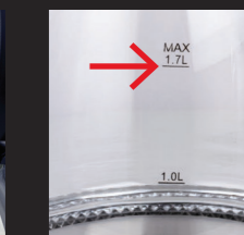
Nicht über die MAX -Markierung hinaus befüllen